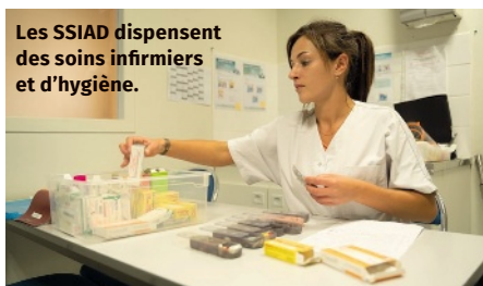
Les SSIAD dispensent des soins infirmiers et d'hygiène.

i Toutes les informations et les lignes directes des SSIAD sont sur Mutuellesdusoleil.fr , rubrique « Réseaux de soins ».